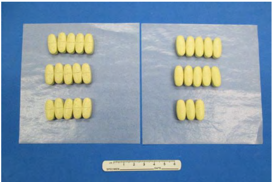
中に入っていた錠剤を薬包紙に並べた様子（28錠入り）