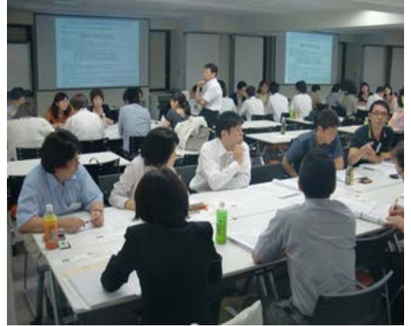
【グループディスカッション風景】

大変勉強になりました。すべての薬剤師および病院スタッフが研修を受けることができればもっと病院のレベルが上がると思います。